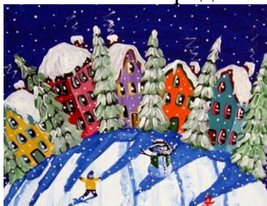
«Зима в городе»

Создавать условия для отражения в рисунке представления о месте своего жительства как одном из «уголков» своей Родины. Продолжать учить рисовать несложные сюжеты или пейзажи. Развивать творческое воображение, способности к композиции. Формировать умение создавать фон гуашевыми красками, используя разные кисти. Закреплять приемы рисования сухой кистью. Воспитывать патристические чувства, интерес к своей Родине.