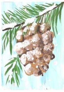
Шишка в снегу.

формирование интереса к эстетической стороне окружающей действительности, воспитание интереса к художественно-творческой деятельности продолжить осваивать основные навыки правополушарного рисования т Освоить основные навыки правополушарного рисования Восприятие света и тени (умение видеть и передавать характеристики цвета) Восприятие целостного образа (умение видеть целое и его части). Воспитывать трудолюбие и желание добиваться успеха собственным трудом;